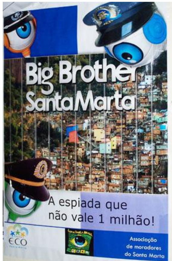
Doc. 2. Affiche élaborée par l'association des habitants du quartier de Santa Marta critiquant la mise en place d'un système de vidéosurveillance des rues de la favela 16

Dans un tout autre contexte spatial, en périphérie ouest de la ville, le quartier Cidade de Deus (Cité de Dieu), composé de plusieurs favelas et d'importantes zones d'habitat collectif, a été le deuxième lieu d'installation d'une UPP (2009). C'est avant tout la proximité directe de la Cité Olympique en cours de construction et la forte résonance médiatique des lieux qui expliquent qu'elle occupe une place prioritaire dans ce dispositif de pacification : Cidade de Deus a, en effet, été rendu internationalement célèbre par la violence criminelle qu'elle abrite, très largement médiatisée depuis le tournage du film éponyme de Fernando Meirelles sorti en 2002. Sa taille a néanmoins rendu le processus d'expulsion des narcotrafiquants armés plus long – et plus violent que pour Santa Marta.