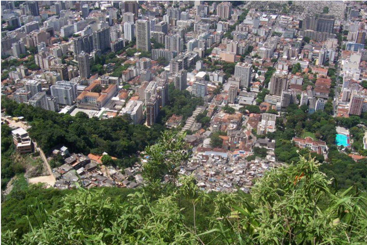
Doc.1. Au premier plan, la favela Dona Marta, au bas de laquelle s'étend le quartier de Botafogo

Cette situation a notamment suscité une forte mobilisation des habitants contre cette décision (Doc.2) . Etant donné sa centralité et le caractère pionnier des initiatives de sécurisation, cette favela est devenue le laboratoire et la vitrine de la politique de sécurité publique de la police militaire de Rio de Janeiro, traduite par l'installation permanente, à partir de décembre 2008, de forces de police pacificatrice.