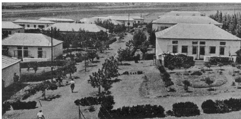
Vue du Kiboutz Ein Harod, fondé en 1921, dans les années 40.