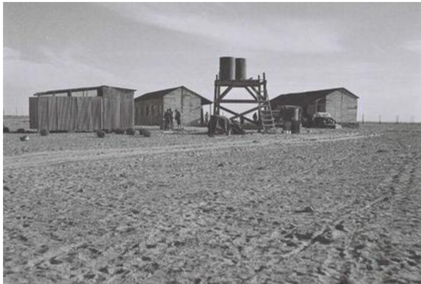
Kiboutz Tze'elim à sa création en 1949

Suite à l'échec relatif de l'intégration des immigrants des années 1950, échec auquel le kiboutz a largement contribué, se sont cristallisés dans la société juive israélienne des années 1960-70 deux secteurs de population, qui au lieu de se "fondre" 2 en une même culture suivant le modèle prôné alors par les élites, se sont constituées en alternatives culturelles qui déboucheront sur le post-sionisme (Kimmerling 2001). D'une part l'Israël des anciens de la période pré-étatique (" vatikim "), élite socio-économique ashkénaze, et d'autre part les nouveaux, pour la plupart Orientaux, prolétariats des régions périphériques. Dans ce clivage, le kiboutz n'est plus perçu comme un mouvement révolutionnaire, avant garde du socialisme, une utopie assoiffée de justice sociale, mais plutôt comme un des compartiments privilégiés de la société, utilisant à ses fins productivistes un prolétariat "fruste" d'origine orientale. En effet, bien qu'opposé idéologiquement au travail salarié, du fait de l'exploitation qui l'accompagne, le kiboutz devient en périphérie de l'espace (social) israélien un des principaux, sinon le principal employeur.