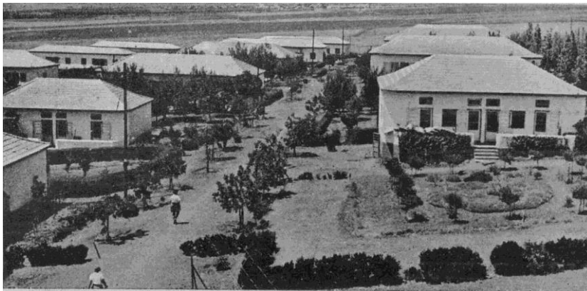
Vue du Kiboutz Ein Harod, fondé en 1921, dans les années 40.