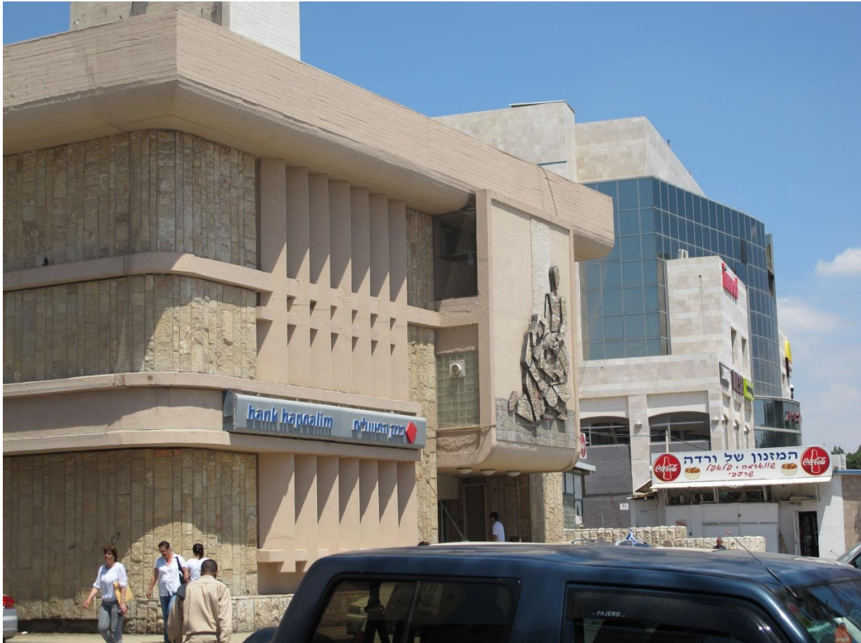
Ancienne mairie transformée en banque, au second plan, le centre commercial qui abrite la nouvelle mairie au dernier étage.

consommer, la perception de la faiblesse du pouvoir d'achat s'accroît. Le nouvel Israël consumériste paraît bien loin du mythe égalitariste qui avait prévalu à ses débuts.