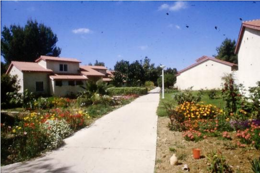
Kiboutz Nahal Oz: Zone d'habitation selon la planification classique avec jardinets et chemins piétons dans un espace ouvert.