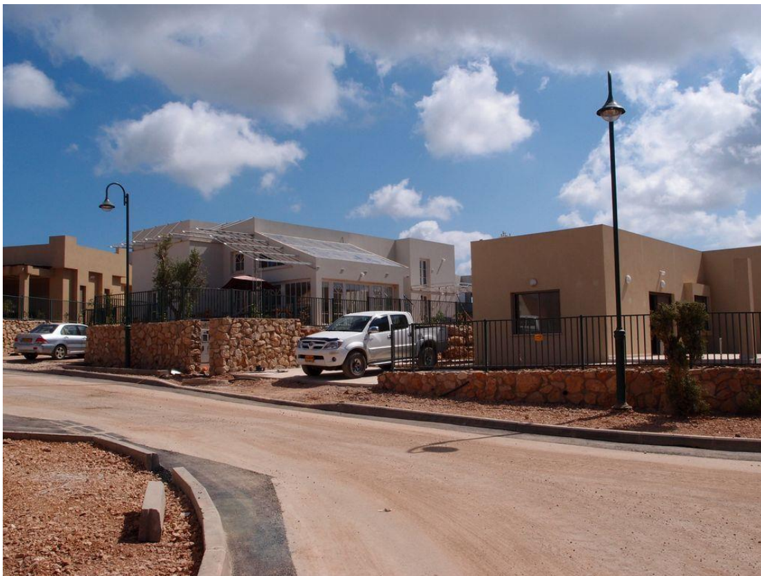
Nouveau quartier d'habitation suivant les plans d'aménagement à l'ère de la privatisation. Kiboutz Hanita 2012.

Aujourd'hui, les plans d'aménagements dessinés à la suite de la mutation des modes de vie, en vue de la privatisation des logements, légitiment la transformation du paysage kiboutzique. Ils fixent les limites de chaque parcelle privée, ils prévoient la fermeture au public de certains chemins, de certains jardinets précédemment ouverts à tous/tes. Les plans et la réalisation des nouveaux quartiers d'habitations, qui se sont multipliés dans les kiboutzim de la périphérie du pays, témoignent également de cette évolution structurelle (irréversible), leurs résidents acquérant 4 une parcelle déjà délimitée et livrée barrières et clefs en main. Dans ces quartiers les espaces communs sont réduits au minimum.