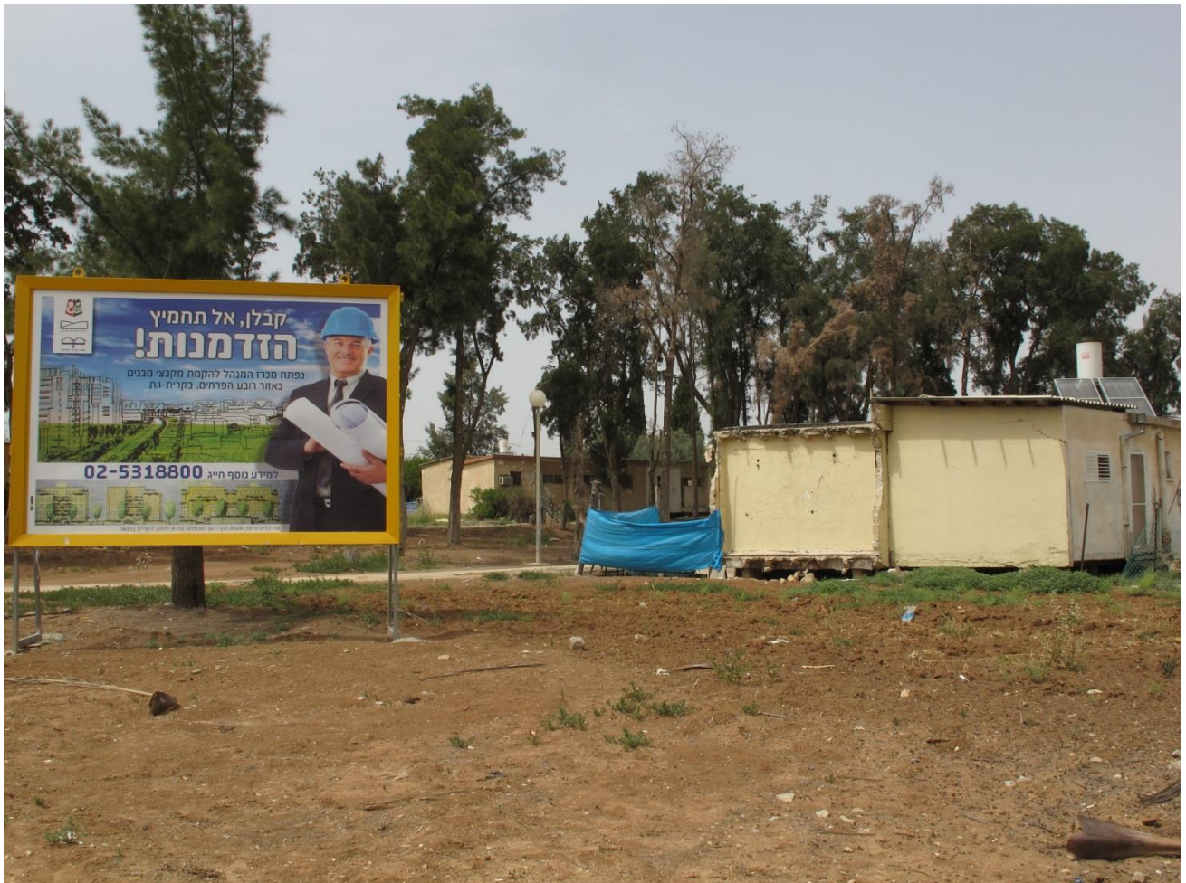
A gauche, une affiche présentant les ambitions de la municipalité, à droite les anciennes ma'abarot vouées à l'abandon politique.

A quelques mètres du centre « d'absorption » où vivent entassés de nombreux Ethiopiens, un nouveau projet immobilier entend attirer les classes moyennes, locales et non locales. L'idée est de (re-)donner une image positive du cœur de la ville nouvelle, secteur le plus économiquement déprimé de la petite agglomération, les nouveaux développements urbains de standing un peu supérieur s'effectuant tous à sa périphérie. Cela est pour partie dû à la promotion immobilière locale, celle-ci souhaitant séduire les employés des nouvelles entreprises récemment installées dans la zone industrielle à quelques kilomètres de Kiryat Gat. Celle-ci était initialement dévolue aux transformations des produits agricoles et à l'industrie traditionnelle, mais ces activités en nette perte de vitesse (l'usine textile de Polgat ferme dans les années 1990) ont été complétées/remplacées par des implantations d'entreprises informatique, domaine dans lequel Israël excelle, mais qui, hormis pour les emplois peu qualifiés, s'insère mal dans une économie urbaine d'une "ville de développement" comme Kiryat Gat. Avec une aide de plus de 500 millions de dollars du gouvernement israélien, une première usine Intel ouvre en 1999 (fabrication du Pentium 4), suivie d'une seconde en 2006/2008. Ces industries high tech ne s'articule à la ville que par une consommation en passant. Malgré la présence de ces entreprises prestigieuses (Intel, HP) et leur indéniable apport financier au budget communal, les